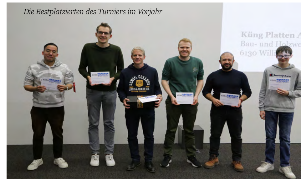
Die Bestplatzierten des Turniers im Vorjahr