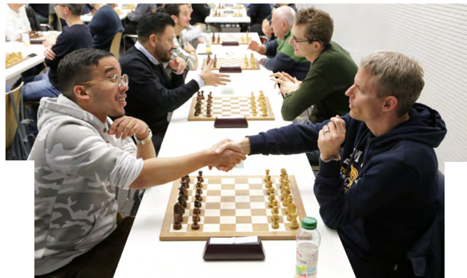
Runde 9: Die Spieler an den Spitzenbrettern reichen sich vor dem Kampf die Hand